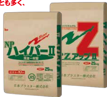
LT工法用ATB既調合モルタル適合商品

※参考: JASS19陶磁器質タイル張り工事のタイル張付け材の判定基準は0.4N/mm 2 以上